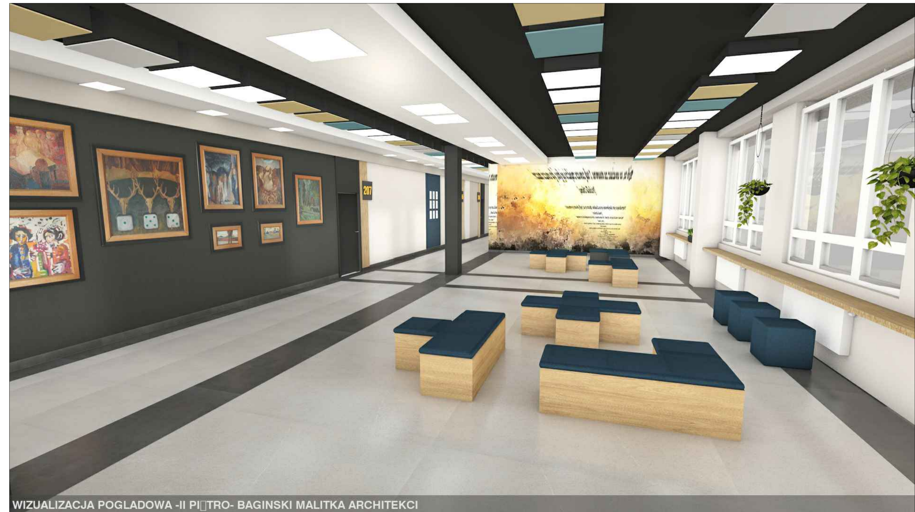
WIZUALIZACJA POGŁADOWA -II PIĘTRO- BAGIŃSKI MALITKA ARCHITEKCI